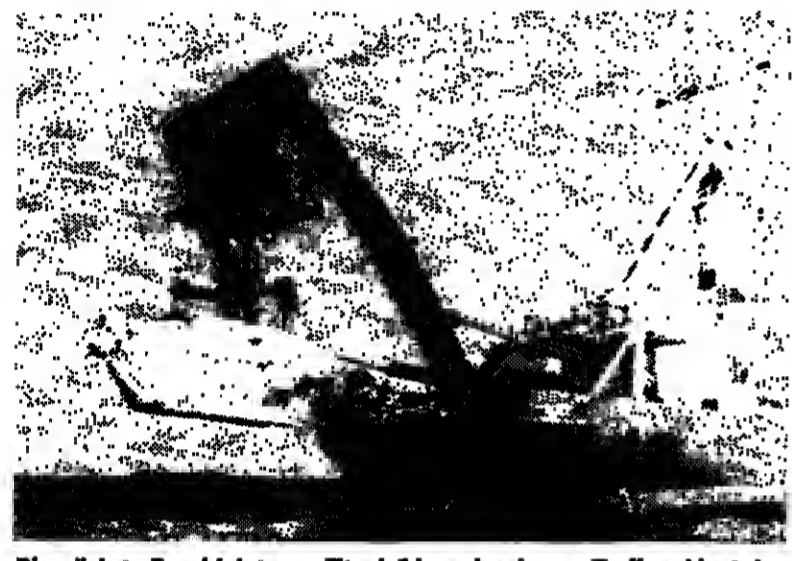
Die nächste Tauchfahrt zur „Titanic“ kann beginnen: Ein Kran holt das U-Boot „Alvin“ vom Mutterschiff „Atlantis“ in das Meer.

Die jetzige „Titanic“-Aktion, die rund 250 000 Dollar kostet, wird zwölf Tage dauern.